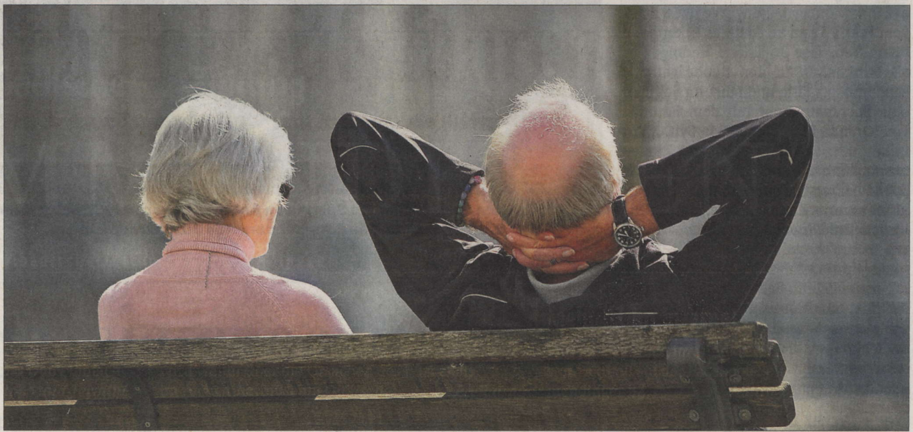
Zurücklehnen ist nicht: Senioren sollen zu mehr Teilhabe in der Kommunalpolitik ermuntert werden.